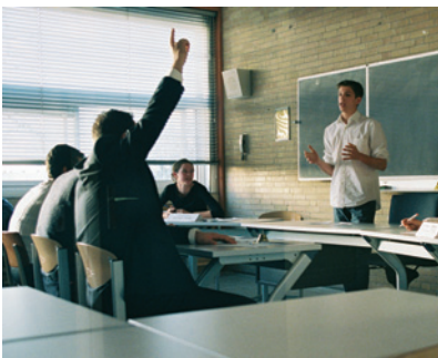
Nog een minuut...