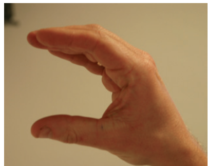
Nog een halve minuut...